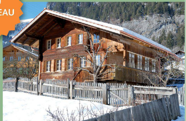
Haus auf der Kreuzgasse — Boltigen (BE)

Unter www.magnificasa.ch finden Sie weitere aussergewöhnliche Häuser.