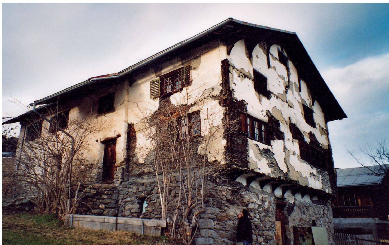
Das Gebäude in Vella (GR), dessen Grundmauern auf das 15. Jahrhundert zurückgehen, zeigte sich 2003 schon vor dem illegalen Abbruch verlottert.

Cette construction située à Vella (GR) dont les fondations remontaient au XV e siècle était déjà très délabrée avant sa destruction illégale.