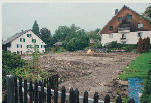
Abbrüst: Auf dem Bauplatz im Zentrum von Birchwil stand bis vor wenigen Tagen ein Bauernhaus aus dem Jahre 1550.

Bauherren Jacques Dürker hat inzwischen mit dem Umzug der wertvollen Hausstelle begonnen, man hat am 12. August mit