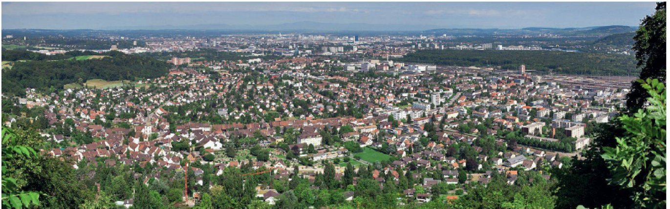
MuttENZ, Wakkerpreis 1983.