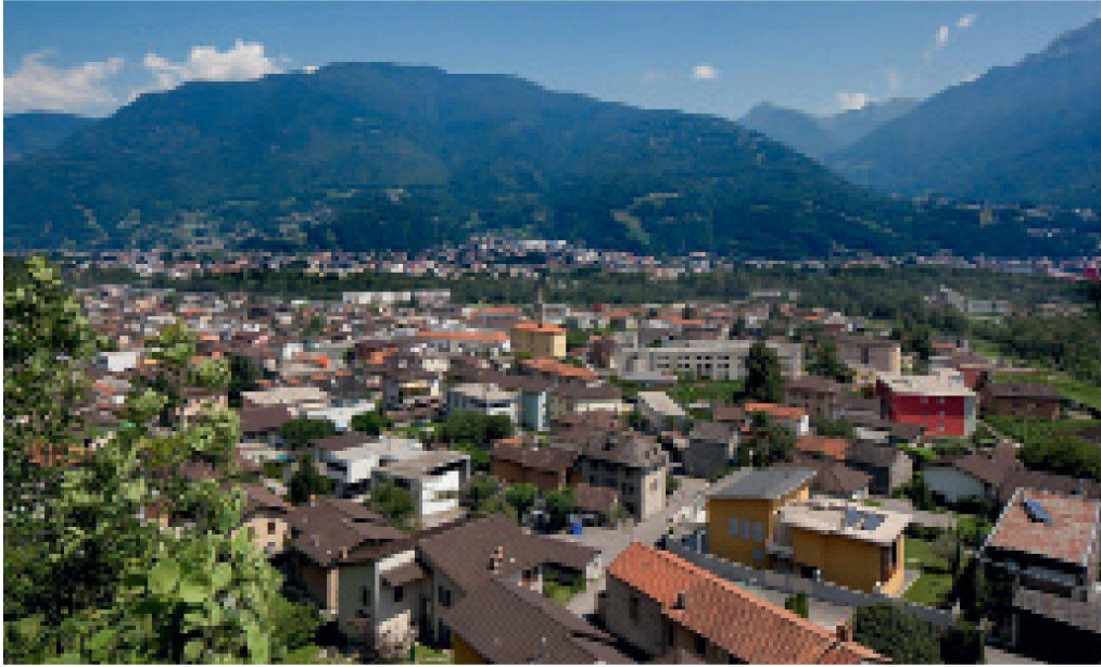
Monte Carasso, Prix Wakker 1993.