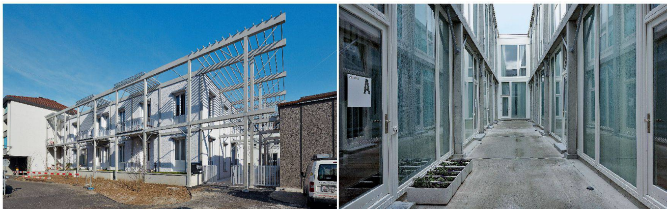
Die Betonelemente an der Fassade der einstigen Lagerhalle (links). Ein neuer Innenhof, der die Wohnungen in der Lagerhalle belichtet (rechts).