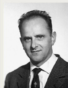
Plinio Martini, Le fond du sac – Les drames de l'émigration dans le Tessin. Actes Sud, 1994. 240 pages, ISBN 978-2-7427-0129-2, CHF 12.50. Titre de l'édition originale de 1970: «Il fondo del sacco»; Photo: Plinio Martini