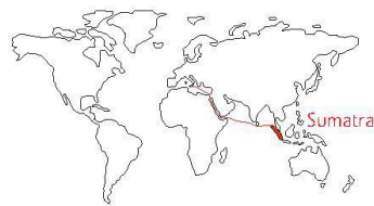
Reise von Sizilien durch den Suezkanal nach Sumatra (Illustration SHS)