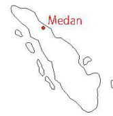
Die Insel Sumatra mit der Ortschaft Medan