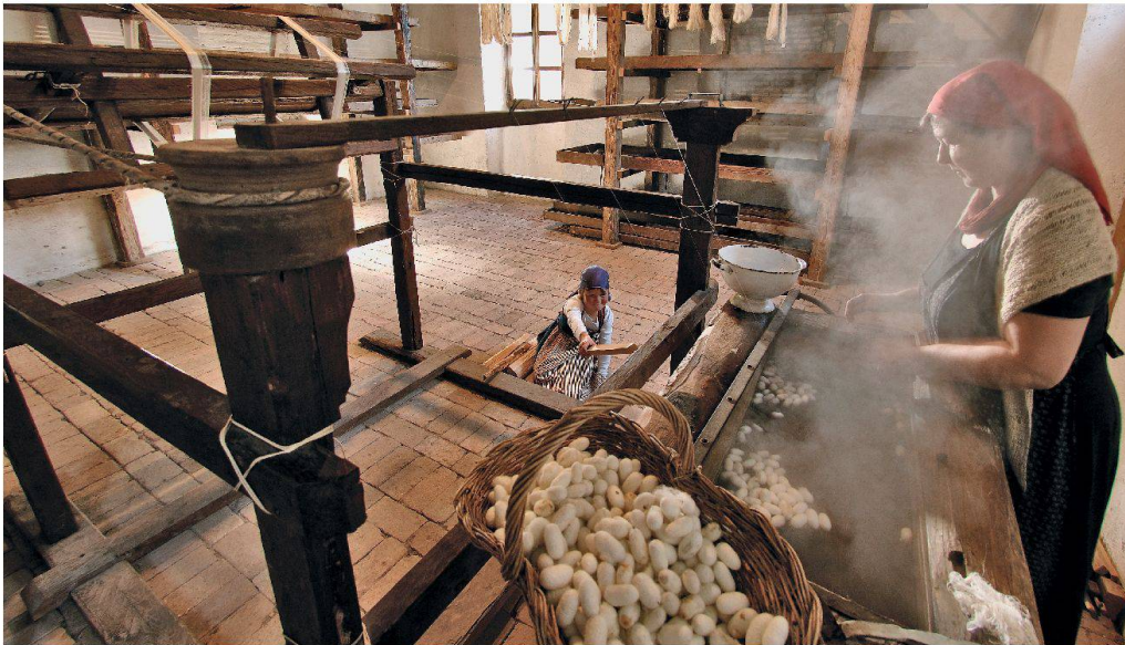
Vielfalt im Freilichtmuseum Ballenberg: Pflege des alten Handwerks und moderne Küche im 450-jährigen Haus von Matten.

Les contrastes du musée de plein air de Ballenberg: anciens métiers d'antan et cuisine moderne dans la maison de Matten datant de 450 ans.