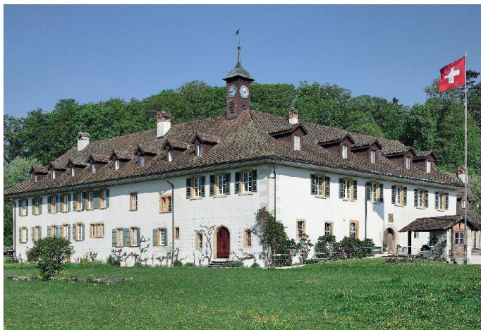
Historisches Hotel des Jahres 2010 ist das «Restaurant & Klosterhotel St. Petersinsel».

Der Verein Pro Riet Rheintal realisiert im Naturschutzgebiet Bannriet bei Altstätten SG das Projekt «Schollenmühle – Natur Bildung Torf». Der Fonds Landschaft Schweiz FLS unterstützt die Umgestaltung der einstigen Torffabrik zu einem Umweltbildungszentrum und die ökologische Aufwertung der Umgebung mit einem Beitrag von 450 000 Franken. Das Projekt will die Kerngebäude der Schollenmühle erhalten. So soll aus der stillgelegten Torffabrik in einem Flachmoor von nationaler Bedeutung ein authentischer Lernort für Umweltbildung werden. Hier werden sich Besucherinnen und Besucher in einem frei zugänglichen Gebäudeteil über das Schollenhandwerk und die geschichtliche Entwicklung des Schollenriets informieren können. Über Einsichtsfenster in den Kerngebäuden werden früher verwendete Maschinen und Gerätschaften zu besichtigen sein. Das Projekt wird mitgetragen von der Vogelwarte Sempach und vom Schweizerischen Vogelschutz. Bund, Kanton, Region, die Stadt Altstätten, die Stiftung Bannriet, weitere Stiftungen und andere Geldgeber leisten Beiträge an die Gesamtkosten von 1 580 000 Franken. Seit seiner Gründung 1991 hat der FLS mehr