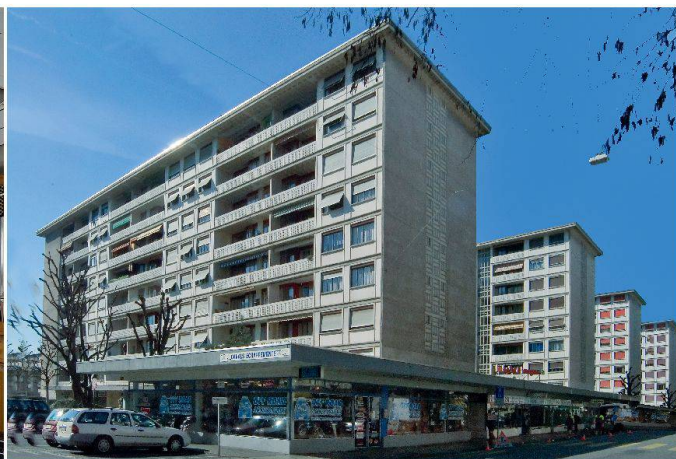
Eglise néo-apostolique, 1949–1950, architectes Werner Max Moser, en collaboration avec Max Ernst Haefeli et Rudolf Steiger, réalisation par Francis Quétant (à gauche). Cité Carl-Vogt, construction 1961–1964, architectes et ingénieurs Honegger Frères (à droite).