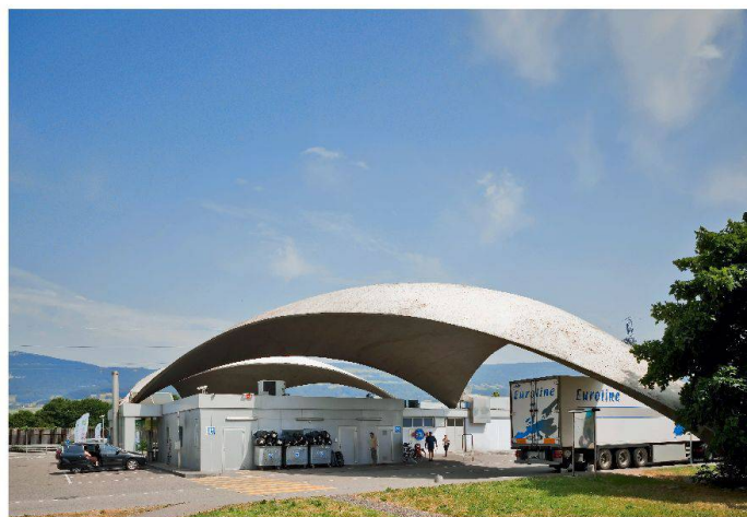
Die Kuppeldächer der Autobahnraststätte Deitingen-Süd blieben erhalten. Die Denkmalpflege stellte die sogenannten Isler-Schalen 1999 unter Schutz.