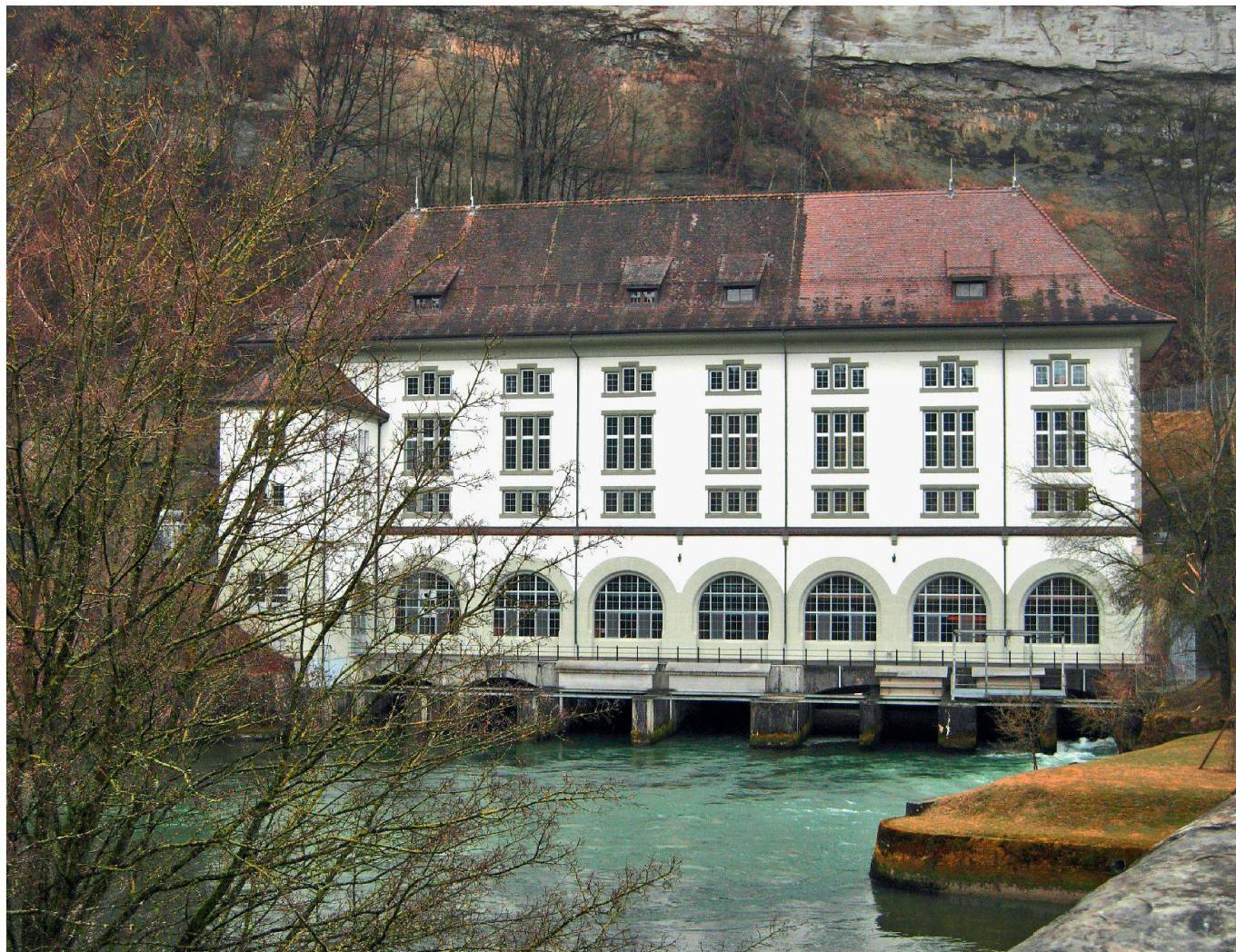
Lors des Journées européennes du patrimoine, l'usine électrique de l'Oelberg (1910) près de Fribourg, alimentée par l'eau de la Sarine, sera ouverte au public.

Das Elektrizitätswerk Oelberg bei Freiburg von 1910 wird vom Wasser der Saane betrieben. Es kann am Tag des Denkmals besucht werden.