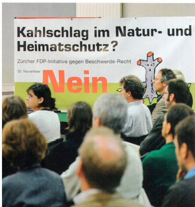
Bundesrat Moritz Leuenberger sprach sich am Auftakt zur Abstimmungskampagne im Namen des Bundesrates am Donnerstag, 4. September 2008, in Bern gegen die Aufhebung des Verbandsbeschwerderechts aus

Le conseiller fédéral Moritz Leuenberger s'est exprimé au nom du Conseil fédéral contre la suppression du droit de recours des organisations, le 4 septembre 2008 à Berne