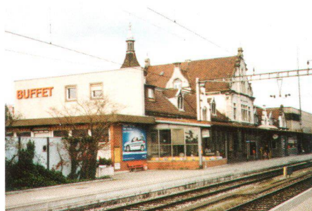
Der Bahnhof Rapperswil vor der Renovation La gare de Rapperswil avant la rénovation

Der Freudentag der Wiedereröffnung gibt Anlass, in der Geschichte einige Jahre zurückzublättern. Ende der 80er-Jahre lancierten die SBB einen Architekturwettbewerb für einen Neubau des Bahnhofes. Das Projekt blieb aus verschiedenen Gründen in den Schubladen stecken. 2001 wurden die Pläne erneut hervorgeholt und überarbeitet. Die Konkretisierung des Bauvorhabens und somit auch der Abbruchabsichten rief den Schweizer Heimatschutz und seine St. Galler Sektion auf den Plan. Sie wiesen die SBB darauf hin, dass es sich beim 1895 vom Architekten Karl August Hiller erbauten Bahnhofgebäude um ein