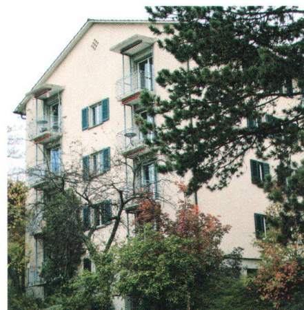
Frau Theiler war an der Wasserwerkstrasse in Zürich – in der Baugenossenschaft für alleinstehende Frauen – wohnhaft

Eine Nachbarin, die Frieda Theiler in deren letzten Lebensjahren eine gute Freundin war, charakterisiert die Verstorbene als bescheiden, kontaktfreudig, unbeschwert, glücklich, eine gute Energie ausstrahlend.