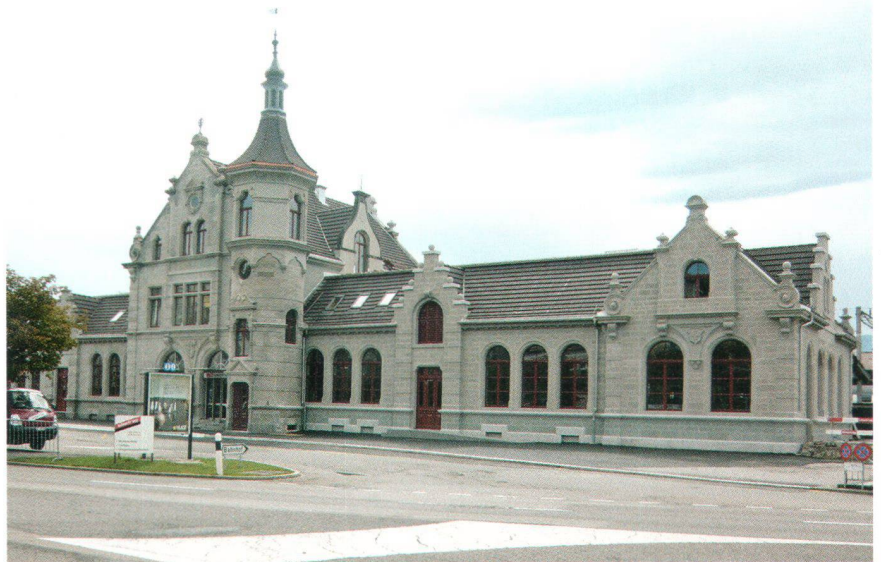
Der frisch renovierte Bahnhof Rapperswil (Bilder SHS) La gare de Rapperswil fraîchement rénovée (photos Ps)

Denkmal von nationaler Bedeutung handeln dürfte. Ein Abbruch sei gemäss Bundesgesetz über den Natur- und Heimatschutz kaum möglich. In mehreren Gesprächen konnte die Bauherrschaft von dieser Ausgangslage überzeugt werden. Wichtige Grundlage dazu war das Gutachten der Eidgenössischen Kommission für Denkmalpflege, welches der Heimatschutz mit Nachdruck einforderte. Die Abbruchpläne wurden begraben, ein umfassendes Renovationsprojekt ausgearbeitet.