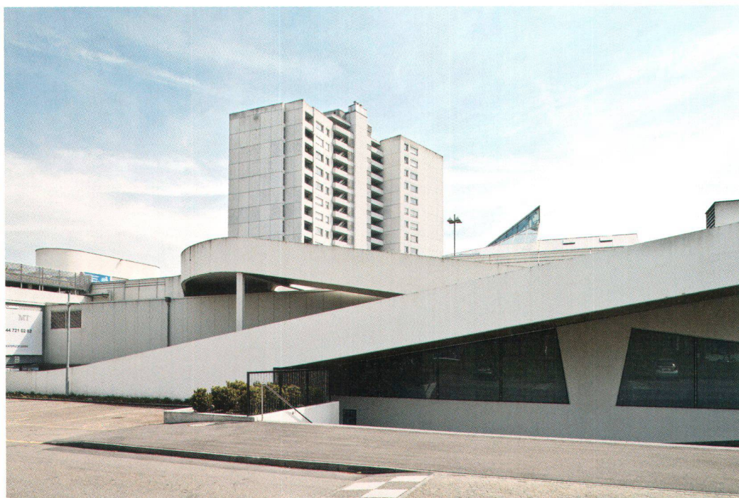
Von der Stadt aus gesehen ist das Hochhaus ein Teil der Betonlandschaft im Schönbühl...