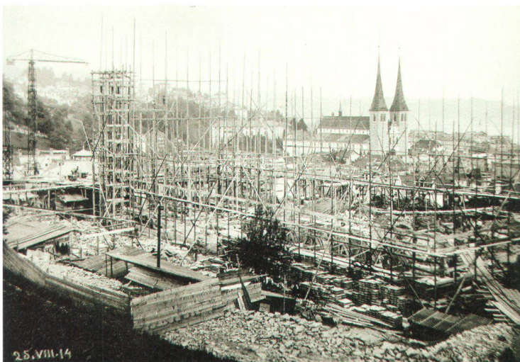
Baustelle der Suva an prominenter Lage in Luzern

Es werden wieder Hochhäuser gebaut in der Schweiz. Verschiedene jüngere Planungen unterliegen zu Recht dem Verdacht, eher der grossspurigen Zurschaustellung ökonomischer Potenz als einer angemessenen städtebaulichen Entwicklung zu dienen. Die Hochhaus-Frage war und ist auch für den Heimatschutz aus Fragen des Stadtbild- und des Landschaftsschutzes von hohem Interesse. Obwohl eine skeptische Haltung vorherrscht, hat sich der Heimatschutz verschiedentlich für den Bau von Hochhäusern stark gemacht. Zwei historische Beispiele aus Luzern belegen, weshalb.