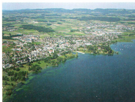
Luftbild von Cham

cka. Chamerinnen und Chamer haben den viel diskutierten Bebauungsplan für die Halbinsel St. Andreas am 9. Dezember 2007 mit überwältigendem Mehr abgelehnt. Bei einer Stimmbeteiligung von annähernd 54 Prozent waren 3030 Stimmberechtigte gegen die geplante Überbauung des Schlossparks, nur 1849 stimmten dem Vorhaben zu. Der Chamer Souverän hat sich klar gegen die notabene vom Chamer Gemeinderat, von den bürgerlichen Parteien sowie vom Gewerbeverein vorbehaltlos unterstützte und von der kantonalen Baudirektion empfohlene Vorlage ausgesprochen und damit für ein anderes, nachhaltiges Vorgehen zum Erhalt von Schloss und Park St. Andreas entschieden. In den kommenden Monaten wird der Zuger Heimatschutz zusammen mit Vertretern des Vereins «St. Andreas ist mehr wert» und des Bauforums Zug erste mögliche Denkmodelle für die Zukunft von St. Andreas in einer Landschaft und einem Ortsbild von nationaler Bedeutung erarbeiten. Dabei sind wir uns bewusst, dass die grosse und nicht unter Denkmalschutz stehende Anlage nach wie vor in Privatbesitz ist und dass Kanton und Standortgemeinde sich künftig mit einem Engagement für die Halbinsel St. Andreas auseinandersetzen werden.