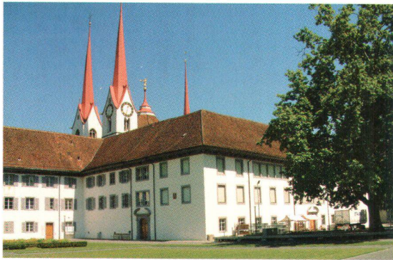
Kloster Muri Couvent de Muri