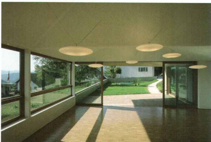
Kindergarten Nenzlingen Jardin d'enfants de Nenzlingen

kh. Der Vorstand der Sektion Baselland hat am 22. September die Gemeinde Nenzlingen für ihre nachhaltige Entwicklungsplanung prämiert. Wie