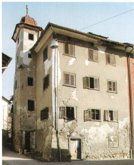
Türalihus, Valendas GR

Mitte Juli konnte die Stiftung als zweites Objekt das Türalihus in Valendas erwerben. Das herrschaftliche Gebäude mit einem markanten Treppenturm, dessen heutiges Aussehen auf das Ende des 18. Jahrhunderts zurückgeht, beeindruckt im Inneren mit reich ausgestatteten, getäfelten Stuben. In nächster Zeit geht es darum, die Arbeiten am stark renovationsbedürftigen Haus zu planen und die nötigen finanziellen Mittel zu suchen. Nach Abschluss der Arbeiten werden im Türalihus drei aussergewöhnliche Wohnungen zur Verfügung stehen.