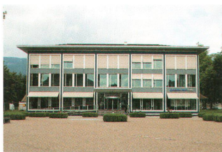
Links: Parktheater in Grenchen Rechts: Baloise Bank SoBa in Solothurn

Gauche: Le théâtre Parktheater à Grenchen