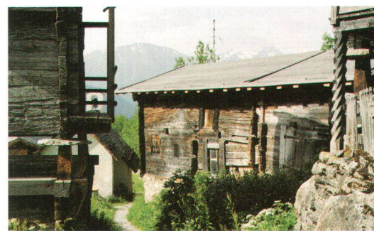
Huberhaus, Bellwald VS