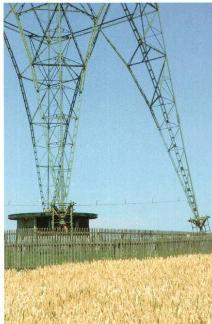
Kletterturm, Jugendradio oder Liebessender? Der Schweizer Heimatschutz sammelte Ideen zur zukünftigen Nutzung des Landessenders Beromünster (Bild SHS)

Vielfältig und originell waren die eingegangenen Vorschläge: Sie reichen von einer Umnutzung des Sendeturms zur Windenergiegewinnung über einen Umbau zum Kletterturm bis zur Installation eines «Liebessenders» in dem geheiratet und das Ja-Wort über den Sendeturm in den Äther geschickt werden kann. Die überzeugendste und realistischste Idee zeigt der Vorschlag «Radio aktiv +»: Dieser sieht vor, im Landessender Beromünster auch in Zukunft ein Radioprogramm zu produzieren. Schülerinnen und Schüler aus der ganzen Schweiz gestalten unter professioneller Anleitung ihre eigenen Projektwochen. Sie erlernen das Radiohandwerk auf dem heutigen technischen Stand und stellen Beiträge her, die über das neue Radio verbreitet werden – sei dies mit eigener Sendeleistung oder in Partnerschaft mit bestehenden Radiostationen. Allenfalls könnte ein historisches Radiomuseum mit alten Tondokumenten, Technik und sonstigem Archivmaterial entstehen, in dem gezeigt wird, wie in den Anfängen des Radios gearbeitet wurde. Die Infrastruktur für «Radio