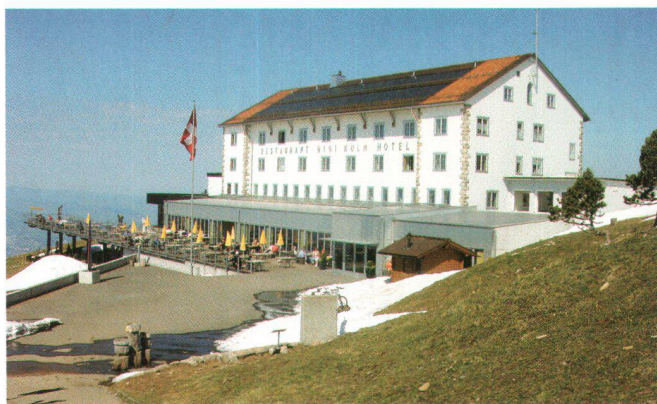
Hôtel Rigi Kulm

In ländlichen Regionen wird auf traditionelle Formen zurückgegriffen, die Architektur bezieht sich auf das Vorhandene und orientiert sich an konkreten Bedürfnissen. So gestaltet der Schweizer Heimatschutz im Rahmen der Schoggitaleraktion 1951 den Rigi-Gipfel neu. Der Heimatschutz-Bauberater und Architekt Max Kopp schafft mit dem Hotel Rigi Kulm (1952–1954) einen viergeschossigen Steinbau mit Satteldach, der an alte Hospizbauten erinnert und sich sowohl von der Moderne wie auch klar vom damals ungeliebten Historismus abwendet.