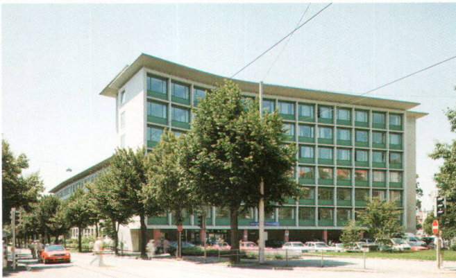
Direction générale des douanes, Berne

Der Umgang mit dem Material und dessen Verarbeitung stehen vor allem in der ersten Hälfte der 1950er-Jahre im Vordergrund. Gesucht werden Kontraste, Kombinationen mit unterschiedlichen Materialien, Farben, Oberflächen und Strukturen. Es geht um Stimmung, Proportionen und hochwertige Handarbeit. Elliptische Handläufe, Staketten-Geländer und fein gearbeitete Fenster kommen auf. Charakteristisch sind sorgfältige Details, wie die abgerundeten Fenstereinfassungen beim Nebengebäude der Oberzolldirektion in Bern von Reinhard und Stücheli (1951–1953).