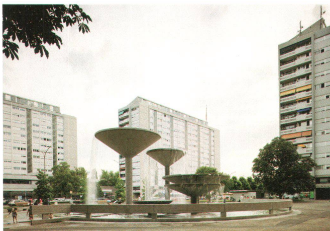
Tours de Carouge

Der Trend zu grossen Überbauungen und Satellitenstädten mit kubischen Baukörpern und flächigen Fassaden in einem internationalen Stil setzt zuerst in der Westschweiz durch. Es entstehen vor allem in der Region Genf grosse Ensembles wie die Cité satellite de Meyrin oder die Cité du Lignon. Die Tours de Carouge (1958–1969), lehnen sich in ihrem architektonischen Ausdruck stark an Le Corbusiers Unité d'Habitation an. Ab Anfang der 1960er-Jahre findet in der gesamten Schweiz vor allem bei öffentlichen Bauaufgaben eine Architektursprache Verbreitung, die sich der aufkommenden Bewegung des Brutalismus annähert.