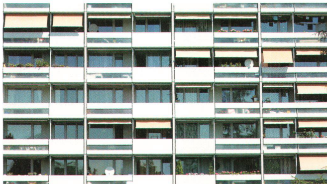
Cité Tscharnergut, Berne Bümpliz

Anfang der 1950er-Jahre beginnen die verbleibenden Modernen um Alfred Roth dem «um sich greifenden sentimental Folklorismus und Traditionalismus» etwas entgegenzusetzen. Sie bereiten in der Deutschschweiz das Terrain für die Abkehr von Raster und Ornament vor und fordern die Wiederbelebung der Architektur im Sinn der klassischen Moderne. Im Zuge der florierenden Wirtschaft setzt eine rege Bautätigkeit ein, die sich in einem Funktionalismus ohne regional gefärbte Ausprägung zeigt.