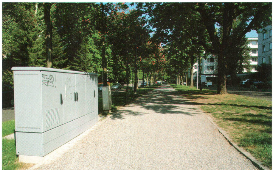
Swisscom-Verteilkabinen Cabines de distribution de Swisscom

rs. Die Swisscom plant in der ganzen Schweiz neue Verteilkabinen für den Anschluss ans Breitbandnetz, also für den Anschluss ans digitale Fernsehen und ans Internet (Bild unten). Für die Ortsbilder wird dies zur Belastung: Denn die Swisscom plant und baut Verteilkästen mit Ausmassen von bis zu 5 m Länge und 1,5 m Höhe. Diese Verteilkästen werden an allen von der Swisscom als geeignet angesehenen Orten aufgestellt, also in Grünanlagen, auf Trottoirs, in Alleen, ja sogar vor Ruhebänken – welch herrliche Aussicht mag der Blick auf eine solche Verteilkabine bieten? Einige wurden in Kellern von Häusern erbaut, jedoch keine unter den Boden verbracht, weil dies zu teuer sei. Der Basler Heimatschutz hat gegen alle Verteilkästen eingeschoben, weil sie den schon arg mit Einrichtungen aller Art beanspruchten städtischen Raum noch verstärkt verstellen. Nun hat der Basler Regierungsrat dem Vorschlag des Basler Heimatschutzes zugestimmt, diese grossen Verteilkabinen unter den Boden zu verbannen.