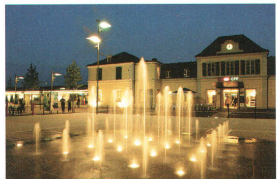
Ergebnisse einer städtebaulich konsequenten Politik: die Innenstadt und der Bahnhofplatz von Delémont einst und heute

Fruits d'une politique de revalorisation conséquente, le centre urbain et la place de la gare de Delémont hier et aujourd'hui