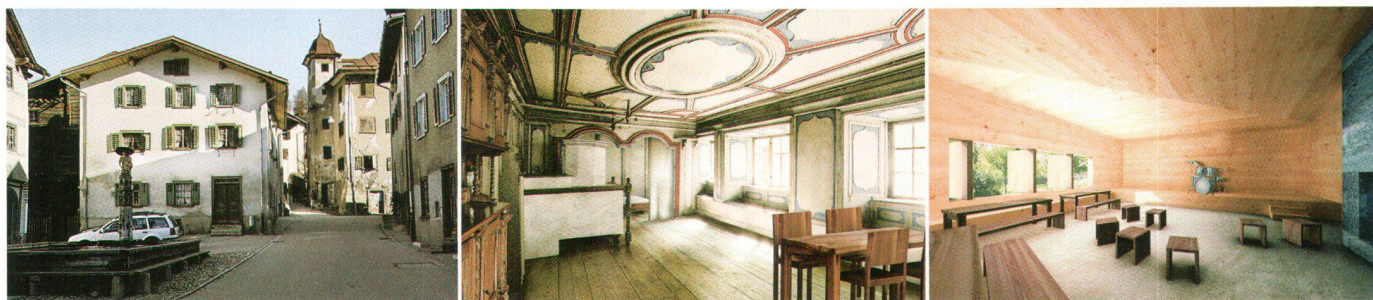
Ständerat machte in Valendas «Ferien im Baudenkmal»