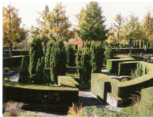
Le cimetière du Bois-de-Vaux allie des éléments de l'architecture paysagère d'inspiration française et italienne

Le cimetière du Bois-de-Vaux est un très beau jardin inscrit à l'inventaire cantonal des monuments et des sites. Considéré dans son ensemble, il nécessite des soins attentifs du Service municipal des Parcs et Promenades. Le développement de la crémation a ralenti le rythme d'utilisation des terrains. Certaines parties du cimetière sont désaffectées et la ville a entrepris des travaux de rénovation visant à réaménager ces secteurs. Le service des parcs et promenades a arraché certaines haies