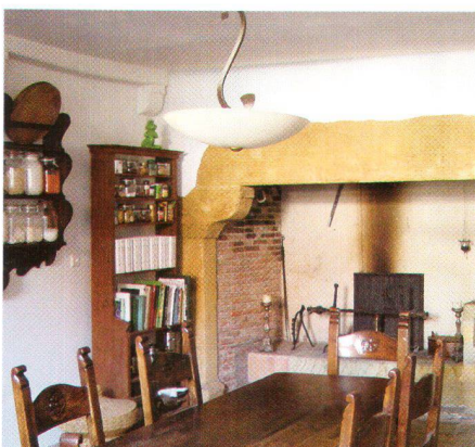
À gauche: le hall d'entrée, à droite la cuisine avec sa cheminée Links Eingangshalle, rechts die Küche mit Kaminfeuer