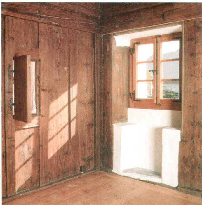
L'ambiance chaleureuse de la maison Rossier est accentuée par des matériaux tels que le bois, la pierre naturelle et la chaux

Denn Reno Pianos «drei Wellen» sei eine prägnante Auseinandersetzung mit dem Maler und dem Gegensatzpaar Natur-Kultur, weshalb ihre Sektion voll und ganz hinter diesem modernen Bau stehe. Als eines der grössten Anliegen der Sektion bezeichnete sie denn auch den Brückenschlag zwischen Altem und Neuem. «Wir wollen wertvolle alte Bausubstanz in das moderne Alltagsleben mit einbeziehen, suchen zukunfts-taugliche Lösungen und beschäftigen uns deshalb mit Fragen der Umnutzung.» Die Gründung des Berner Heimatschutzes durch einen Kreis um Otto von Greyerz im Februar 1905 sei eine Reaktion auf die ersten negativen Auswirkungen des technischen Fortschritts gewesen. Heute könne die Sektion mit ihren 3200 Mitgliedern stolz auf eine erfolgreiche Tätigkeit zurückblicken. Doch es stünden ihr bewegte Zeiten und neue Herausforderungen bevor, meinte sie weiter und nannte dabei namentlich den ungebremsten Bodenverschleiss, die nur mangelhaft erfassten Schutzobjekte des 20. Jahrhunderts und das bedrohte Verbandsbeschwerderecht. Gleichzeitig plädierte sie für eine professionelle Öffentlichkeitsarbeit, vereinsinterne Reformen und Partnerschaften mit Dritten. – Andreas und Raphael Urweider umrahmten die Feier mit einem poetisch-musikalischen Dialog zum Thema «Heimat», eine von Peter J. Aepli redigierte Festschrift, Führungen durch das Klee-Zentrum und ein Bankett ergänzten den Jubiläumsanlass.