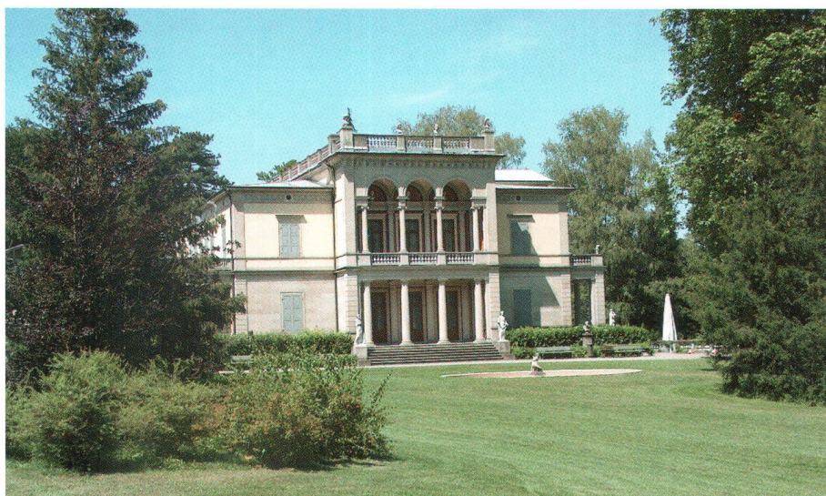
Der Rieterpark mit dem Museum Rietberg

Unter kundiger Leitung werden am Vormittag zwei Anlagen besucht, die ausgezeichnete Beispiele der beiden grossen historischen Gartenströmungen darstellen: