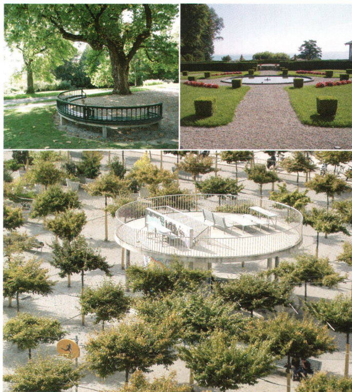
En haut à gauche: créé sur les bases d'un jardin de villa baroque, le parc de Mon-Repos à Lausanne est ouvert au public et comprend plusieurs petits pavillons.