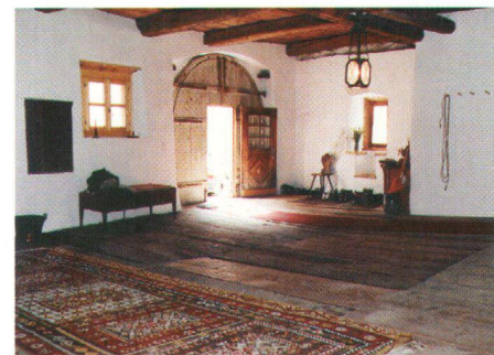
Erneuert, aber diskret: der Sulèr (Bild A. Meili) Le Sulèr, rénové, mais discret (photo A. Meili)

1994 wurden die Fassaden fachmännisch herausgeputzt (Bild A. Meili)