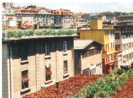
Le prix des jardins 2000 a été attribué à l'association « Jardin urbain » pour l'organisation d'une exposition originale à Lausanne