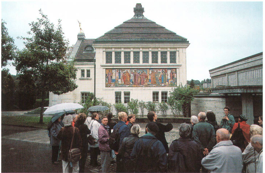
Auf Exkursionen, wie dieser in La Chaux-de-Fonds, lässt sich Baukultur spannend und anschaulich vermitteln

Schweizer Heimatschutz will ernst machen