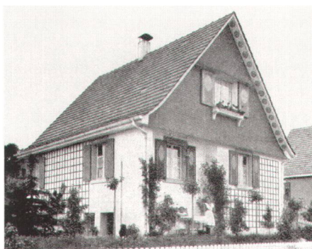
Links: Zeitlos mutet dieses «Beispiel eines guten billigen Einfamilienhauses...» aus «Heimatschutz» 12/1909 an. Rechts: Das Schwitler-Haus in Basel, ein «Klassiker» der neuen Schweizer Architektur, wurde von der SHS-Zeitschrift schon vor seiner Realisierung veröffentlicht.