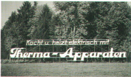
Fort mit Freilandreklamen!