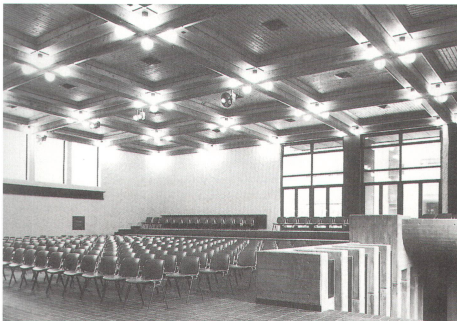
Zusammen mit andern Fachkreisen hat sich der Bündner Heimatschutz erfolgreich gegen den Abbruch der Kantonsschule Chur (hier deren Aula) gewehrt und dem geplanten Neubau gravierende Mängel nachgewiesen.

Ensemble avec d'autres organisations spécialisées, la section grisonne de Patrimoine suisse s'est opposée à la démolition de l'école cantonale de Coire (sur la photo son aula) et a montré les graves lacunes du projet de reconstruction