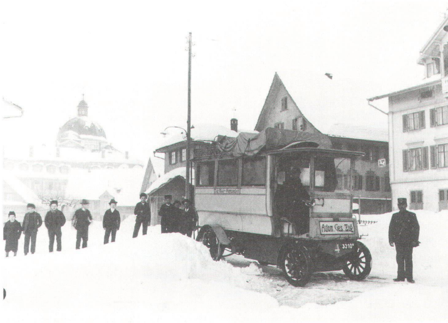
Der Orion-Autobus im Winter 1907 in Menzingen

L'autobus Orion durant l'hiver 1907 à Menzingen