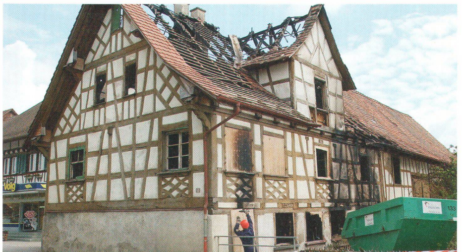
Nach dem Brandanschlag auf das Menzi-Haus, wird gegen Belohnung nach den Tätern und ihren Motiven gesucht.

H.R. Das wertvolle Riegelhaus inmitten des Dorfes, das wegen eines Parkplatzes (!) für den benach-