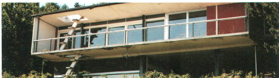
Die Villa Dumas in Villars-sur Glâne La villa Dumas à Villars-sur-Glâne