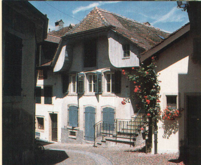
Wakkerpreis 2000: Bauen am Wasser in Genf Grosserfolg: Die schönsten Bäder der Schweiz Estavayer-le-Lac, Talerobjekt 2000