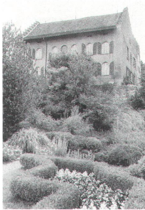
Barockgarten und Schloss Wellenberg. Jardin baroque et château de Wellenberg.

Schloss Wellenberg ausgezeichnet: Anlässlich der Jahresversammlung des Thurgauer Heimatschutzes (THS) vom 5. August überreichte dessen Präsident Heinz Reinhart den diesjährigen Preis seiner Sektion der Familie Schenkel auf Schloss Wellenberg in Felben-Wellhausen. Damit würdigte der THS das grosse Engagement einer Bauernfamilie, die dieses Schloss seit genau 100 Jahren vorbildlich unterhält und die Last eines mittelalterlichen Schlossbesitzers als Aufgabe und Verpflichtung gegenüber Eltern und Grosseltern versteht. Die Anfänge von Schloss Wellenberg gehen auf das 13. Jahrhundert zurück. Im Verlaufe seiner Geschichte wechselte die Liegenschaft häufig den Eigentümer, diente unter anderem als Zürcher Vogteisitz und sollte eine