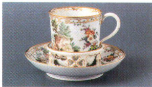
Oben: Trembleuse mit Blumen- und Landschaftsdekor, um 1775; Unten: Soldat mit Pferde als Allegorie Europas, um 1770.

En haut: trembleuse avec décor de fleurs et paysages, 1775 environ; en bas: soldat avec chevaux, allégorie de l'Europe, 1770 environ.