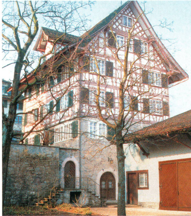
Das Horgener Agentenhaus wurde 1737 erbaut.