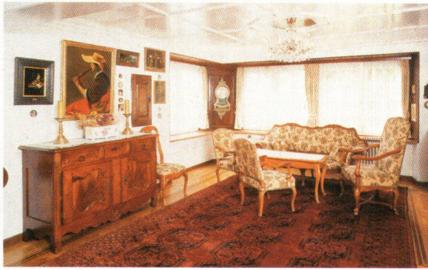
Berner Sitzgruppe im Louis XV-Stil im Musikzimmer. Fauteuils bernois de style Louis XV, dans le salon de la musique.

schaftsbildern, Zeichnungen und Stichen der näheren und weiteren Umgebung sowie antike Möbel vorwiegend regionalen Ursprungs, Uhren, Textilien, Teppiche, Keramik, Leuchter, Zinn usw. vom 16. bis 20. Jahrhundert. Gemäss Stiftungsurkunde soll das Agentenhaus und dessen Ausstattung so erhalten bleiben, wie es der Stifter eingerichtet hat, was es zu einem hervorragenden Beispiel des immer seltener werdenden antiquarischen Wohnstils der zweiten Hälfte des 20. Jahrhunderts macht.