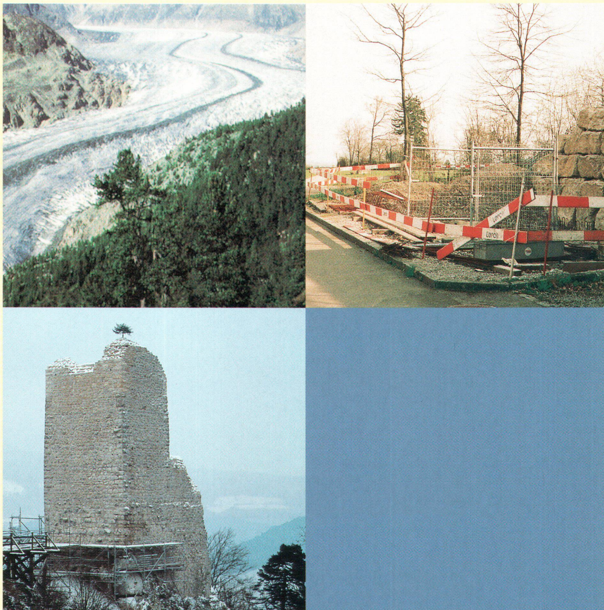
Aletsch, Ecu d'or 1999