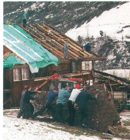
Aufräumen nach den Verwüstungen «Lothars» in St. Stephan BE. Travaux de déblayage après le passage de «Lothar» à St. Stephan/BE.