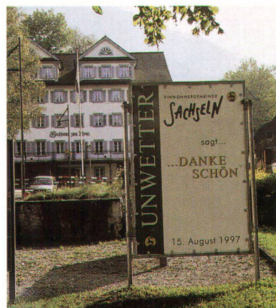
Geste sympathique après le mouvement de solidarité nationale.

Les auteurs du projet primé se sont inspirés des paroles de «Frère Nicolas» (Nicolas de Flüe) qui aurait relaté sa vision d'une fontaine. Ils n'ont pas oublié non plus les références aux scènes de l'histoire sainte de Sachseln. La fontaine qu'ils ont dessinée symbolise les témoignages de foi et le caractère poétique du lieu. Lors de la présentation, Peter Aebi, membre du jury, a d'ailleurs rappelé la traditionnelle procession aux flambeaux qui traverse aujourd'hui encore cette place. Les chances de réalisation du projet sont bonnes car la commune a prévu, dès la mise au concours, d'attribuer les mandats d'exécution aux auteurs des travaux primés. Il reste néanmoins à attendre l'accord de la Confédération qui, dans le cadre du projet P 31 – l'aménagement du centre du village fait partie intégrante du détournement du ruisseau – devrait verser une contribution importante pour couvrir le total des dépenses estimé à environ 30 millions de francs.