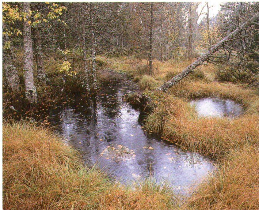
Un site de rêve dans le paysage jurassien: le haut-marais appelé étang de la Gruère. C'est un des principaux objectifs de l'Écu d'or 1997. Verträumt in die Jura-Landschaft eingebettet liegt das Hochmoor Etang de la Gruère, eines der Hauptobjekte der Taleraktion 1997.

La vente de l'Écu d'or 1997 sera ouverte le 31 août lors de l'émission «Mitenand» de la télévision DRS. Elle aura lieu du 6 au 20 septembre en Suisse alémanique et du 29 septembre au 4 octobre en Suisse romande et italienne. Certaines régions cherchent encore des bénévoles (enseignants et élèves) pour cette campagne. Pour tout renseignement, prière de s'adresser au bureau chargé de l'organisation de la vente, tél.: 01 262 30 86.