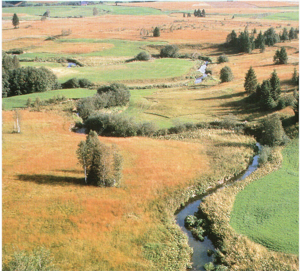
Politischer Zankapfel und Ausgangspunkt des gesetzlich verankerten Moorschutzes bildete das Hochmoor von Rothenthurm.

Der Talerverkauf 1997 wird am 31. August eröffnet mit der Sendung «Mitenand» im Fernsehen DRS und findet dann vom 6.–20. September in der deutschen und vom 29. September bis 4. Oktober in der französischen und italienischen Schweiz statt. Für einzelne Regionen werden dafür immer noch freiwillige Helfer (v.a. Lehrer und Schüler) gesucht. Anmeldungen nimmt das Talerbüro unter Telefon 01 262 30 86 gerne entgegen.