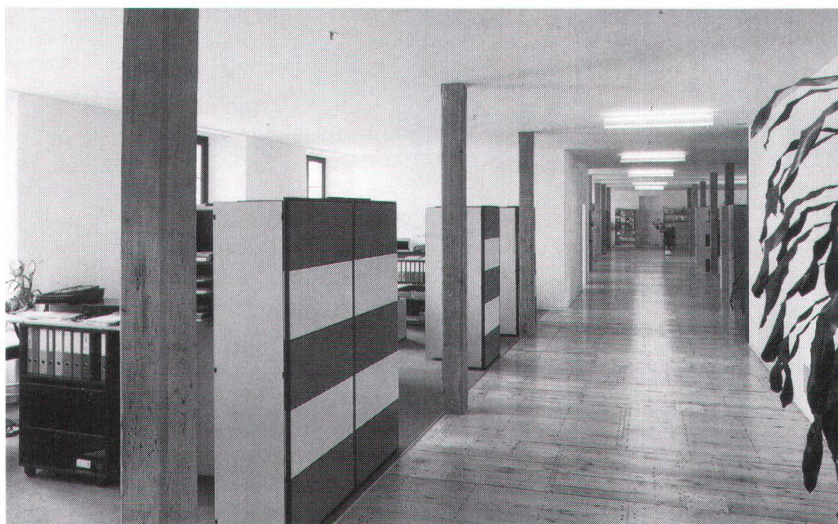
Von oben nach unten: Spinnereimaschinensaal um 1910, vor der Umnutzung im Jahre 1994 und nach der Büroeinrichtung, 1997.