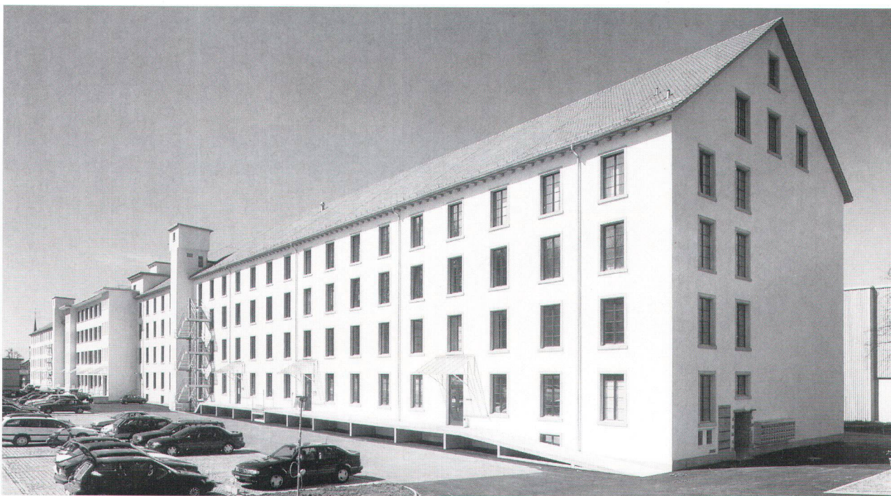
Arrière du bâtiment restauré de la filature de Baar et espace libéré par la démolition des annexes.