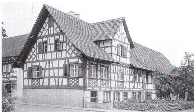
Das Menzi-Haus als Video-Thema.