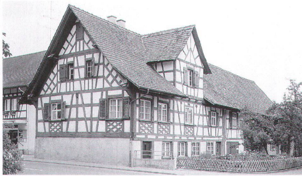
Das Menzi-Haus als Video-Thema. La maison Menzi en vidéo.