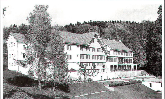
Vom 17. Jahrhundert bis heute ist der Gasthof Gyrenbad in Turbenthal in mehreren Etappen erweitert worden.