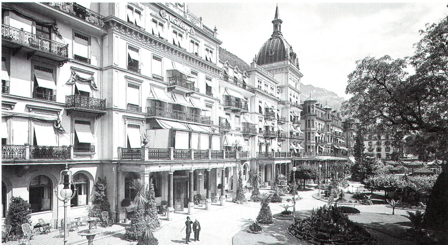
Historische Ansicht des Grand Hotels «Victoria-Jungfrau» in Interlaken. Ancienne vue du Grand Hôtel «Victoria-Jungfrau», à Interlaken.

Die Tourismus- und Hotelbranche wünscht: