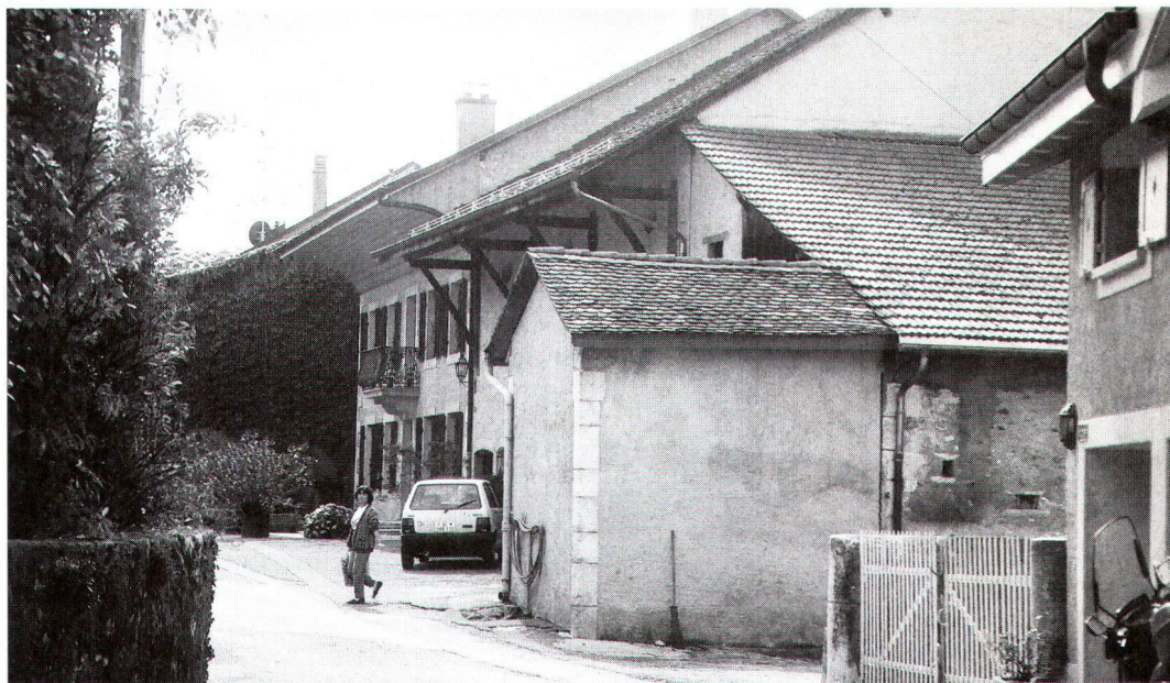
Le caractère originel de Dardagny n'a pu être préservé partout...

Muttenz und Dardagny profitieren heute von guten Schutzmassnahmen (Gesetze und Verordnungen), wobei deren Umsetzung aber von der jeweiligen administrativen und politischen Situation abhängt. Der Einfluss von Eigentümern und Architekten auf Umbauten ist in Muttenz deutlicher zu spüren als in Dardagny, dies u.a. weil die Landwirtschaft in Muttenz stärker zurückgegangen ist. Die natürliche Umgebung einer Gemeinde im ländlichen Teil des Kantons Genf lässt sich kaum mit der eines Dorfes in der Basler Agglomeration vergleichen. Trotz des städtischen Drucks bemüht sich Muttenz aber, mit dem Zonenplan 1995 die freien Flächen hinter den Dorfhäusern zu erhalten. Die Fragen, die sich durch die Idee eines Wakker-Preises an sich stellen, betreffen eher die Dynamik als die Statik. Kulturelles Erbe muss respektiert werden, aber es gilt auch, die Entwicklung der Gesellschaft und die zukünftigen Bedürfnisse einzubeziehen. Auch der Einfluss von Restaurierungen und Denkmalpflege auf die Einstellung der Bevölkerung ist nicht zu unterschätzen.