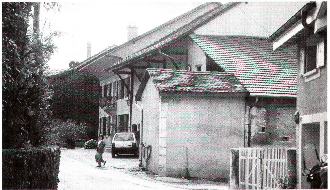
Le caractère original de Dardagny n'a pu être préservé partout...

MuttENZ und Dardagny profitieren heute von guten Schutzmassnahmen (Gesetze und Verordnungen), wobei deren Umsetzung aber von der jeweiligen administrativen und politischen Situation abhängt. Der Einfluss von Eigentümern und Architekten auf Umbauten ist in MuttENZ deutlicher zu spüren als in Dardagny, dies u.a. weil die Landwirtschaft in MuttENZ stärker zurückgegangen ist. Die natürliche Umgebung einer Gemeinde im ländlichen Teil des Kantons Genf lässt sich kaum mit der eines Dorfes in der Basler Agglomeration vergleichen. Trotz des städtischen Drucks bemüht sich MuttENZ aber, mit dem Zonenplan 1995 die freien Flächen hinter den Dorfhäusern zu erhalten. Die Fragen, die sich durch die Idee eines Wakker-Preises an sich stellen, betreffen eher die Dynamik als die Statik. Kulturelles Erbe muss respektiert werden, aber es gilt auch, die Entwicklung der Gesellschaft und die zukünftigen Bedürfnisse einzubeziehen. Auch der Einfluss von Restaurationen und Denkmalpflege auf die Einstellung der Bevölkerung ist nicht zu unterschätzen.