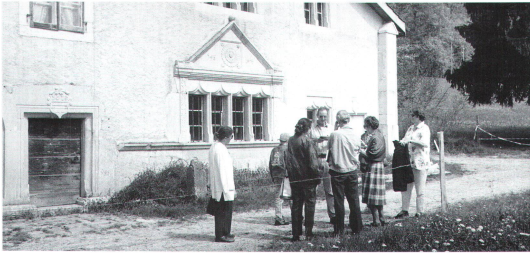
Au programme des «Balades», il y a aussi des visites commentées de remarquables maisons paysannes, comme celle-ci (de 1604) à La Chaux-de-Fonds.

Zum Programm der «Balades» gehören auch kommentierte Besuche kostbarer Bauernhäuser, wie dieses von 1604 in La Chaux-de-Fonds.