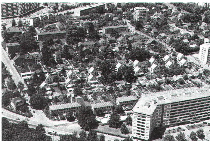
En haut/au centre: La cité-jardin d'Aire avec ses bâtiments caractéristiques des années vingt avant leur transformation. En bas: le même quartier aujourd'hui.

Dans le village de Landecy, un groupe de jeunes ménages achète une imposante bâtisse rurale et envisage sa transformation dans un esprit coopératif. La charge des montants hypothécaires – en constante fluctuation – et l'économie générale de cette transforma-