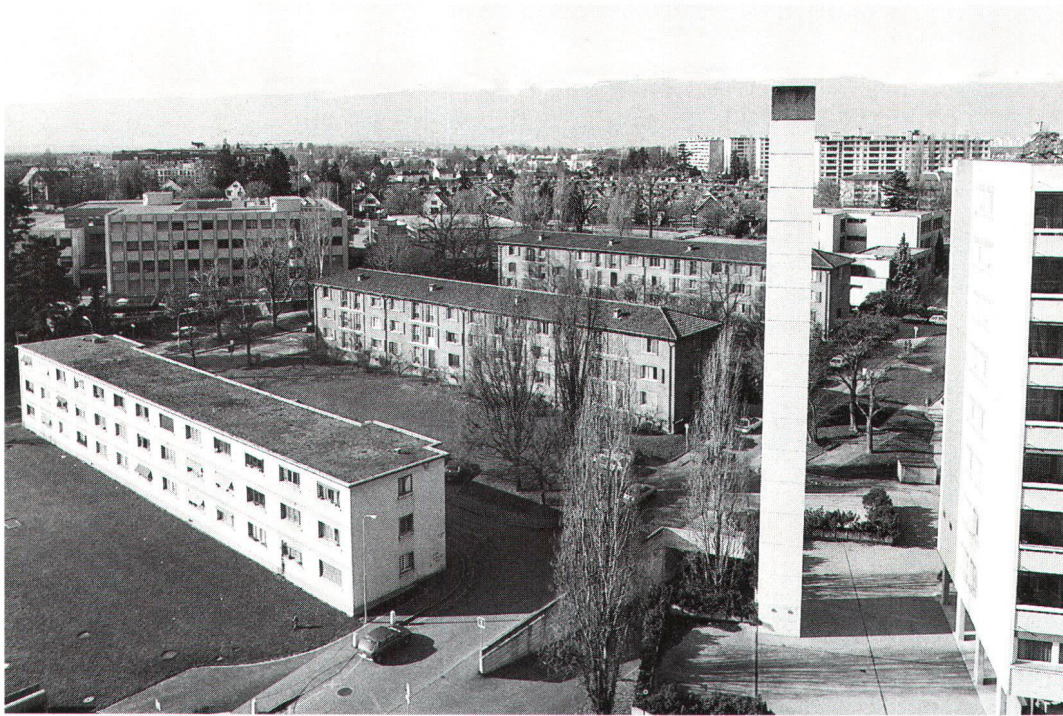
Coopérative d'habitation de Cité-Vieusseux à Genève: à gauche, un bloc datant de 1931; au centre, deux bâtiments érigés en 1946/47 et devant, à droite un nouvel immeuble de huit étages.

Genossenschaftliche Wohnungsanlage in der Genfer Cité-Vieusseux: vorne links ein Block von 1931, in der Bildmitte zwei 1946/47 entstandene Bauten und vorne rechts ein neues achtstöckiges Wohnhaus.