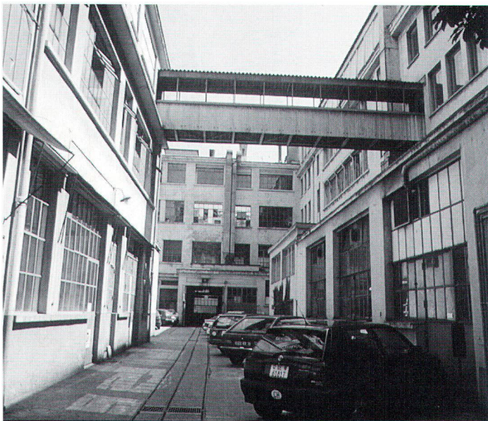
Im Hof der ehemaligen Fabrik SIP, die das Museum für moderne Kunst beherbergen wird.