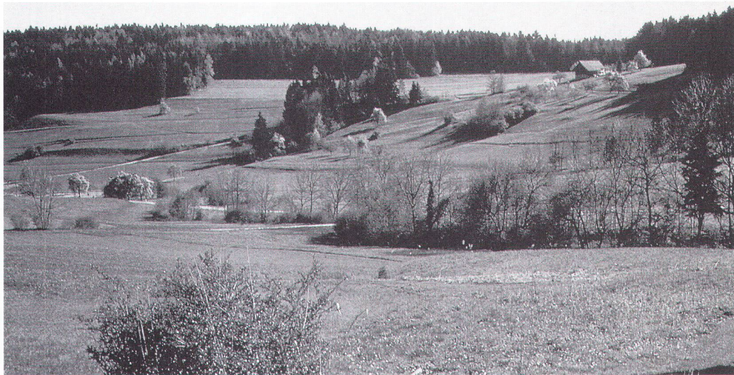
Abstention, EEE ou CE – c'est à nous-mêmes qu'il appartient de choisir la meilleure voie pour sauvegarder une nature riche en espèces.

nes, les changements seront sans doute notables. Si les moyens débloqués pour les paiements directs sont insuffisants, les possibilités de correction seront limitées. On peut s'attendre à des mises en jachère de surfaces considérables, surtout dans l'option CE, qui, en l'absence de mesures appropriées, finiraient par se reboiser – évolution qui, sous l'angle strictement paysager, n'est pas forcément regrettable. Sur le Plateau, et surtout dans l'hypothèse CE, on devrait assister à un renforcement de la tendance actuelle à l'augmentation de la taille des exploitations et, dans le cadre des mesures de rationalisation, à l'exploitation de surfaces plus importantes. Cette évolution entraînerait une pression sur les éléments formant l'armature du paysage, avec comme conséquence une uniformisation à grande échelle et donc une banalisation accrue. Il est malaisé d'apprécier si cette tendance pourra être compensée par l'exploitation extensive de certaines terres. A cela s'ajoute le développement des agglomérations, plus marqué dans les scénarios EEE et CE. Il est clair que là où la nature et le paysage sont déjà fortement sollicités, la pression ne fera que s'accroître.