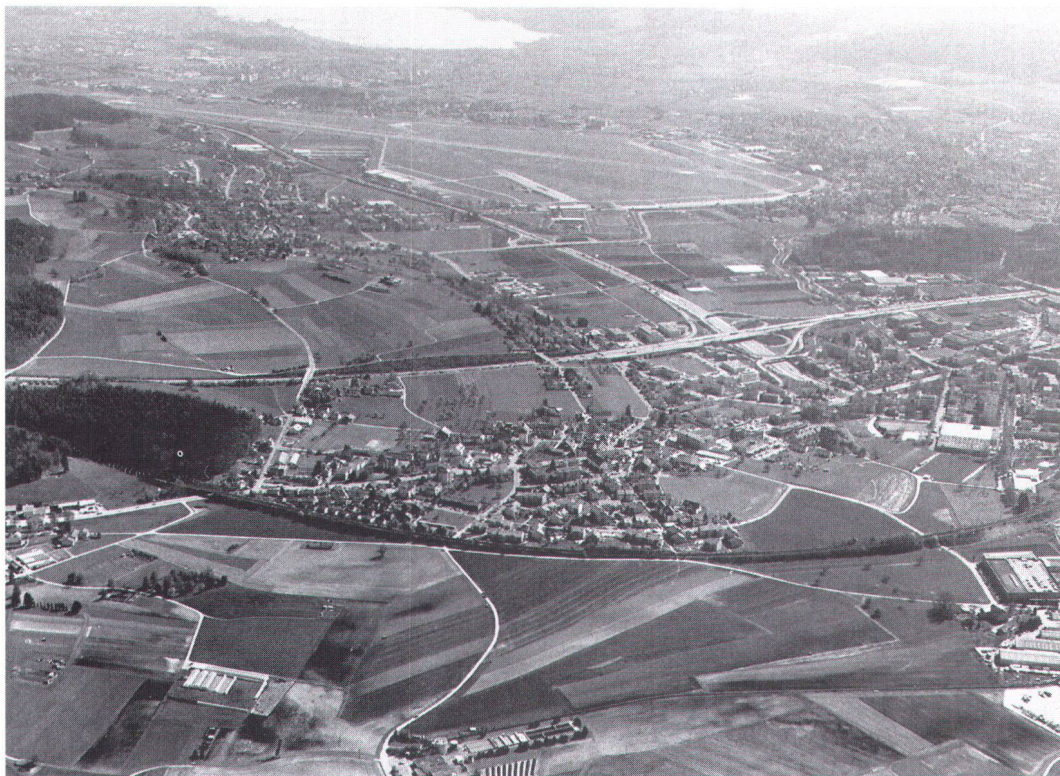
Changements d'aspect d'une agglomération – ici dans la vallée de la Glatt ZH: naguère paysage de marais (photo de gauche, 1923); aujourd'hui nœud routier et centre de développement des services de toute espèce (photo de droite, 1991).

Für Direktor Bruno Wallimann vom Bundesamt für Umwelt, Wald und Landschaft zeigt die zahlenreiche Untersuchung zwar keine Katastrophe, wohl aber einen Schwelbrand, der vor allem durch seine Dynamik, Intensität und seine Jahrzehnte währende Stetigkeit beunruhigt. Dass die Landschaften laufend auf der Verliererseite stünden, liege möglicherweise daran, dass für solche Güter die Preissignale zu schwach seien, dass uns «Natur» zwar lieb, aber nicht teuer sei. So kommt die Untersuchung zum Schluss, dass der Druck auf die Landschaft umfassend ist, unvermindert anhält und ihre Belastungsgrenzen bereits überschritten sind. Deshalb seien deren Funktionen in ein Gleichgewicht zu bringen, müsse die Landschaft vom Siedlungsdruck dauerhaft entlastet und ihre Naturnähe gefördert werden. Dazu sei es nötig, dem Siedlungswachstum nach aussen räumlich Grenzen zu setzen und die bauliche Entwicklung in der offenen Landschaft den Erfordernissen der Land- und Forstwirtschaft, des ökologischen Ausgleichs und der Eigenrechte der Natur unterzuordnen. Ferner gelte es, die ökonomischen und ökologischen Funktionen der Landschaft und die Eigenrechte der Natur raumplanerisch zu sichern und sich im Landschaftsraum auch der Renaturierung und des «Rückbaus» naturferner Eingriffe anzunehmen.